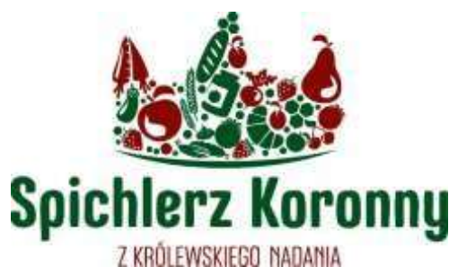
Rysunek 5: Logotyp Marki Lokalnej Spichlerz Koronny

Bardzo ważne z punktu widzenia rozwoju produktów lokalnych jest wprowadzona w 2018r. Marka Lokalna „Spichlerz Koronny”. Marka ta ma przypisany odpowiednio prowadzony proces certyfikacji, dzięki któremu znak marki otrzymują lokalne produkty najwyższej jakości. Po czterech edycjach naboru wniosków w skład grona wyróżnionych Znakiem Marki „Spichlerz Koronny” wchodzi: 23 podmioty, a wraz z nimi w portfolio Marki znajduje się ponad 30 produktów spożywczych, 7 produktów użytkowych, 4 produkty rękodzielnicze, 3 usługi i jedno lokalne wydarzenie. Marka ta staje się coraz bardziej rozpoznawalna wśród klientów, gdyż producenci wprowadzają oznakowanie produktów logo Marki i w trakcie sprzedaży eksponują statuetki Marki. Jednak aby realne rozpoznawanie produktów certyfikowanych, a tym samym realny wpływ Marki „Spichlerz Koronny” na wybory zakupowe klientów były zdecydowanie większe LGD musi ponieść nakłady na odpowiednią promocję i wsparcie rozwoju Marki, dlatego niniejsza LSR przewiduje dedykowane Marce „Spichlerz Koronny” przedsięwzięcie, w ramach którego zostaną sfinansowane nie tylko materialne narzędzie promocyjne, ale także powstaną materiały do promocji w prasie, telewizji i internecie, co z pewnością realnie zwiększy rozpoznawalność tego znaku jakości.