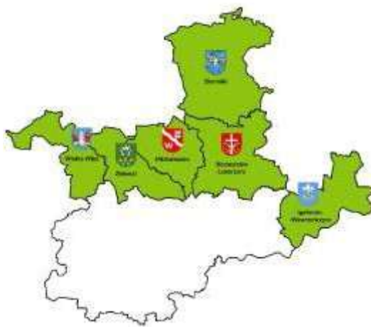
Rysunek 1: Mapa obszaru objętego LSR

Poniżej, na rysunku 1 przedstawiona jest mapa wykazująca spójność przestrzenną obszaru objętego LSR z zaznaczeniem granic poszczególnych gmin wchodzących w skład LGD.